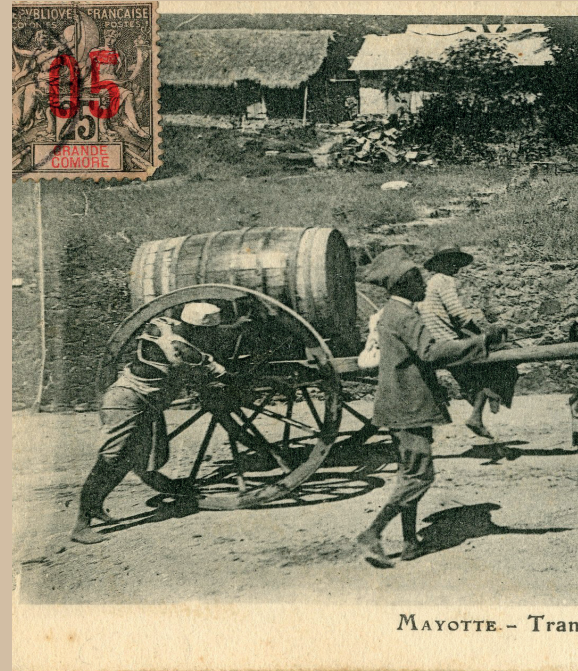
MAYOTTE - Tran

Les consignes administratives arrivent à Mayotte au moyen d'un télégramme. Les voyageurs européens sont accueillis et logés chez un métropolitain déjà installé à Mayotte, puis reçus par le gouvernement de la colonie.