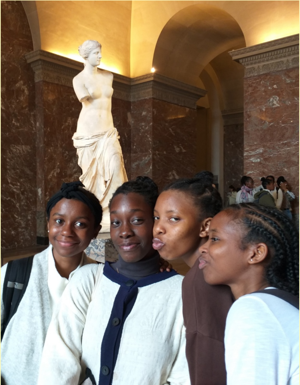
Quatre « Aphrodite » pour un casting dans La Vénus de Milo (bientôt sur Netflix, 4 saisons prévues)

14h30 – 17h : visite du Louvre : quelques œuvres majeures puis quartier libre dans le musée