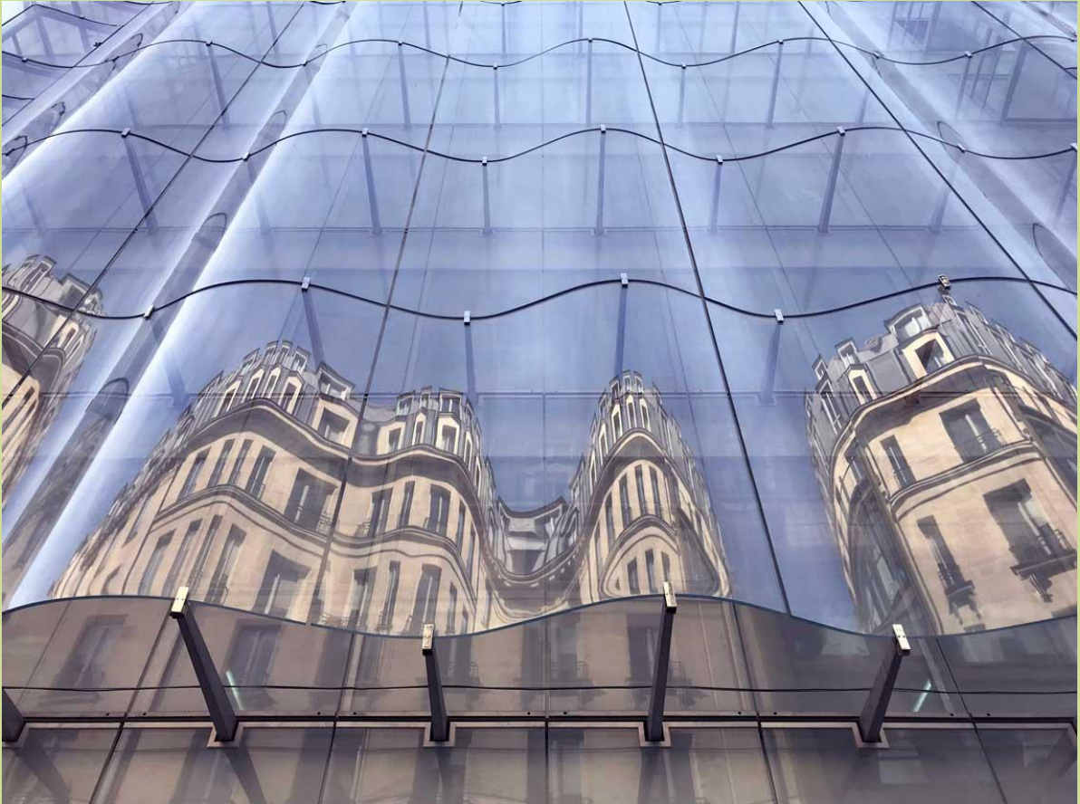
Une façade de verre sur laquelle ondule le reflet des bâtiments haussmanniens.

Les professeurs, eux, ont choisi La Samaritaine , tout récemment réouverte... après 15 ans de travaux !