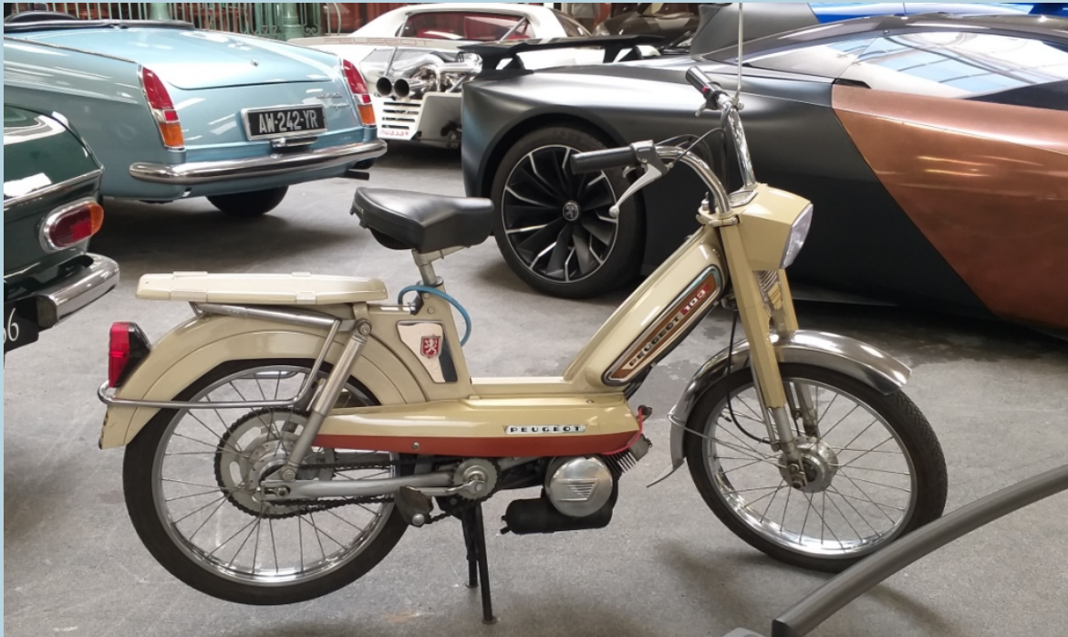
103 LVS (modèle luxe, avec chrome et suspension arrière). All made in France, version 1971. Une époque !

10h – 11h15 : musée de l'Aventure Peugeot. Bravo aux élèves, capables de faire un compte rendu en direct !