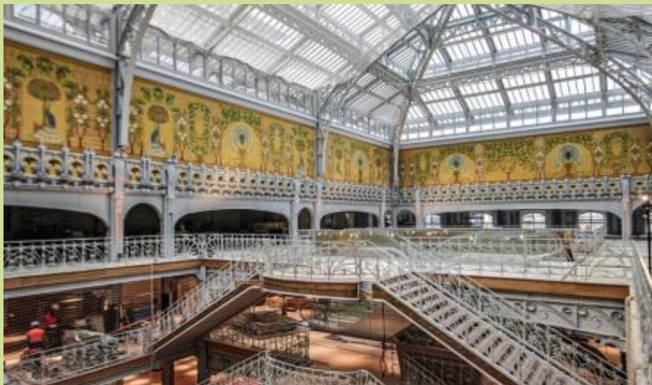
L'intérieur aussi vaut le détour. Les artisans embauchés par LVMH ont bien du talent.