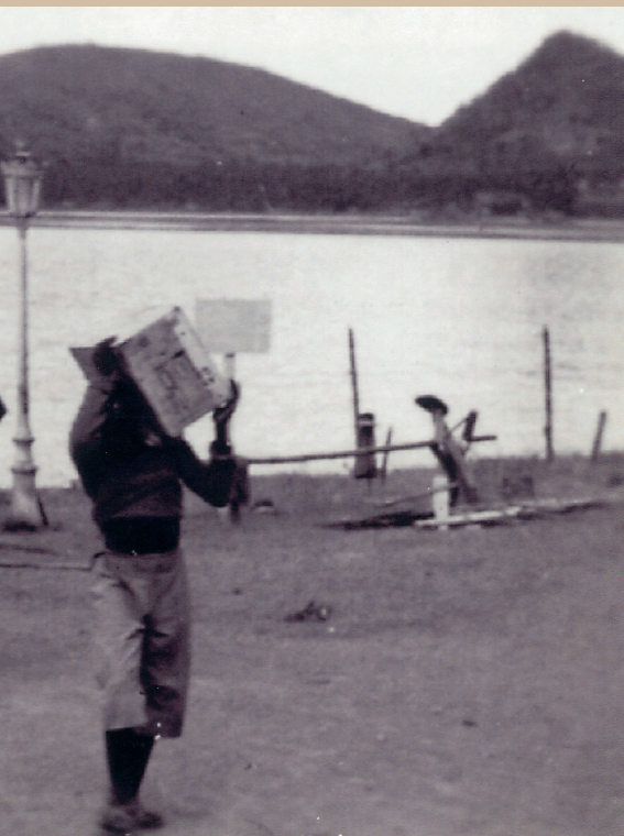
e de l'armée anglaise en 1942.