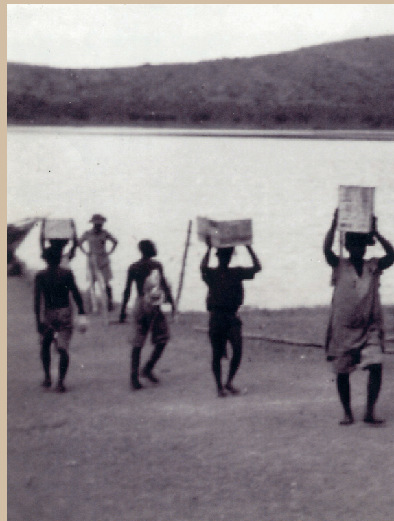
Travailleurs maorais au service

À Mayotte la présence anglo-saxonne ne bouleverse pas la vie quotidienne des Mahorais. Les relations entre les Anglais et Français sont cordiales.